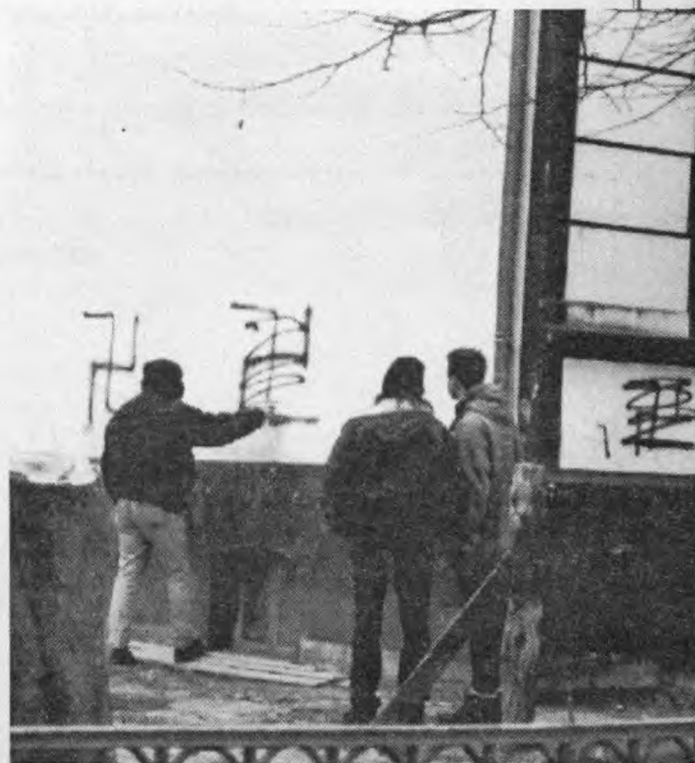
Demonstranten entfernen die Hakenkreuze von den Wänden des verbrannten Flüchtlingsunterkunft in Hafenstraße Lübeck!